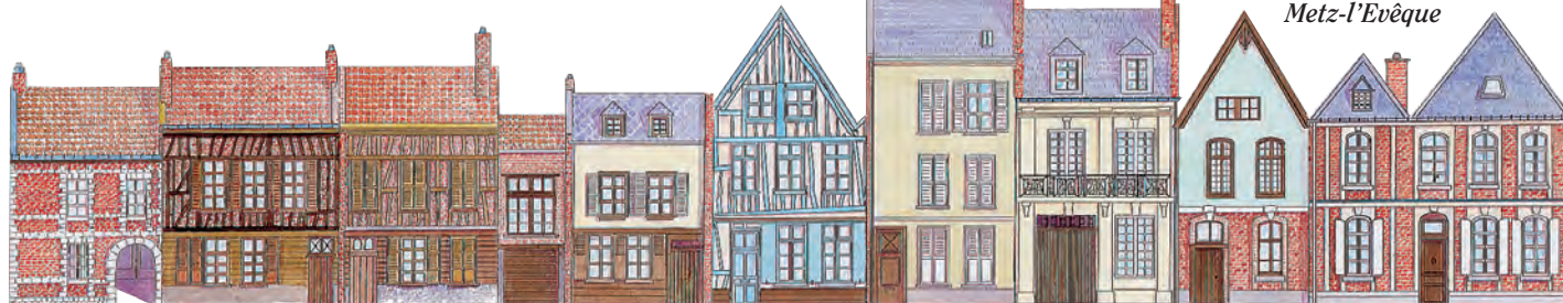
La rue Metz-l'Evêque